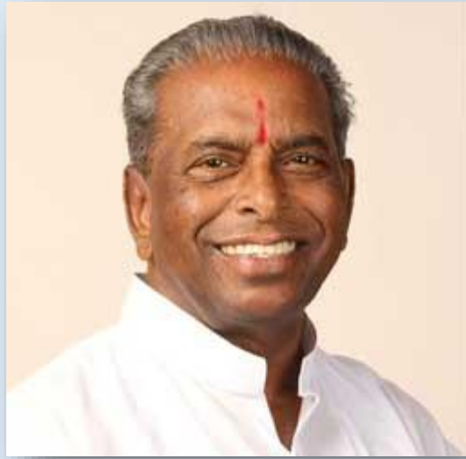
HON'BLE SHRI ANNASAHEB DANGE