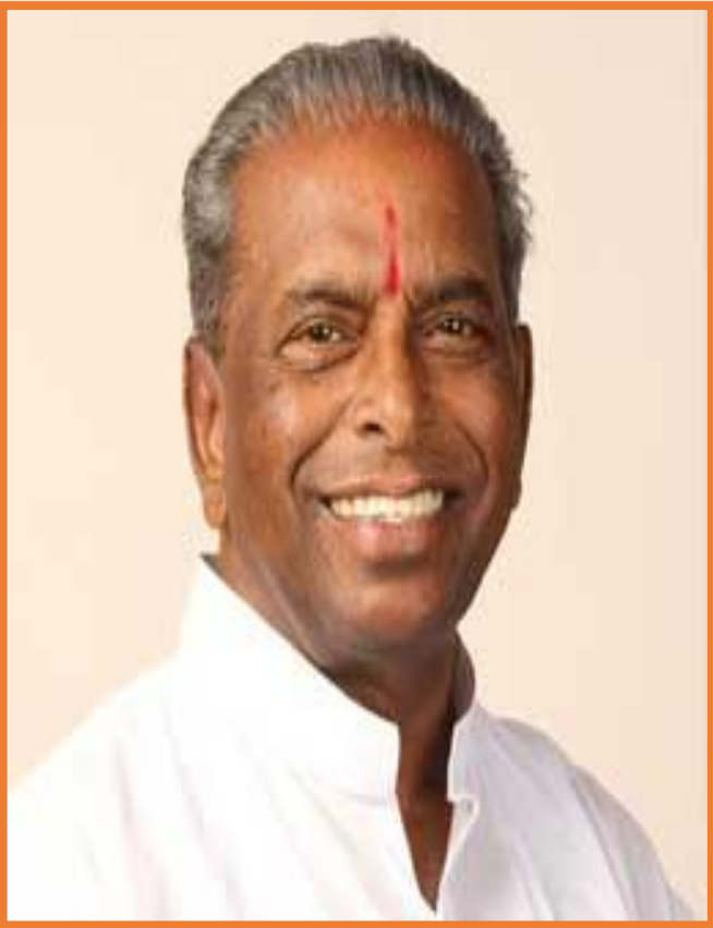
Hon. Shri. Annasaheb Dange